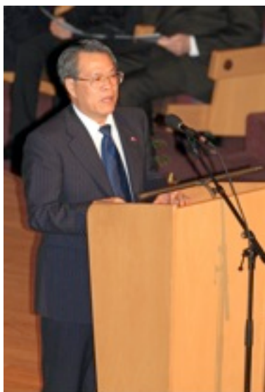
... Botschafter Zeng Xianqi bei der Rede über die Beziehungen China-Luxemburg und...